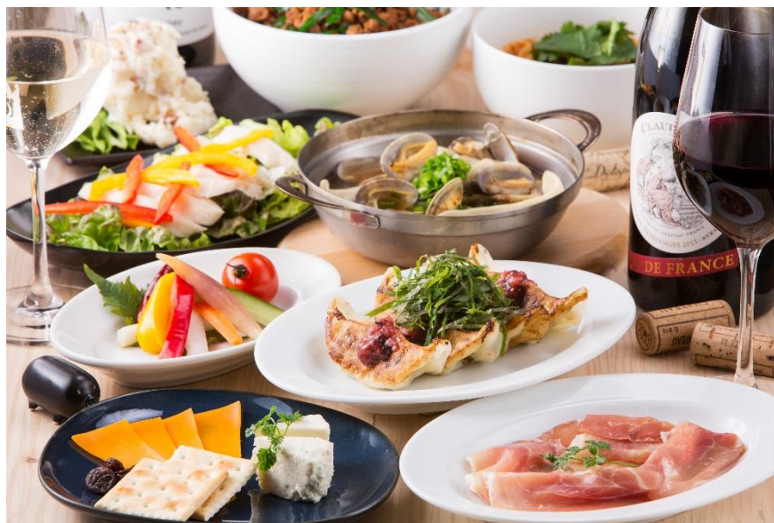
▲ディナーメニューイメージ